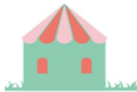
グルメ物販 ワークショップ